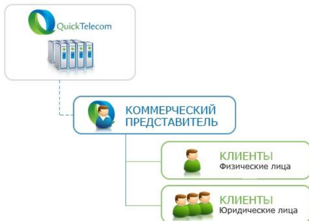
Схема подключения агента:

В мире современных технологий существует масса способов для привлечения новых клиентов в компанию телекоммуникационных услуг связи, ниже приведены лишь некоторые из них которые помогут Вам начать работать и успешно зарабатывать: